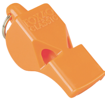
Sound-producing device (one per boat)