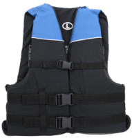
USCG approved & properly fitted life jacket