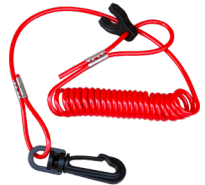
Safety Lanyard attached to operator